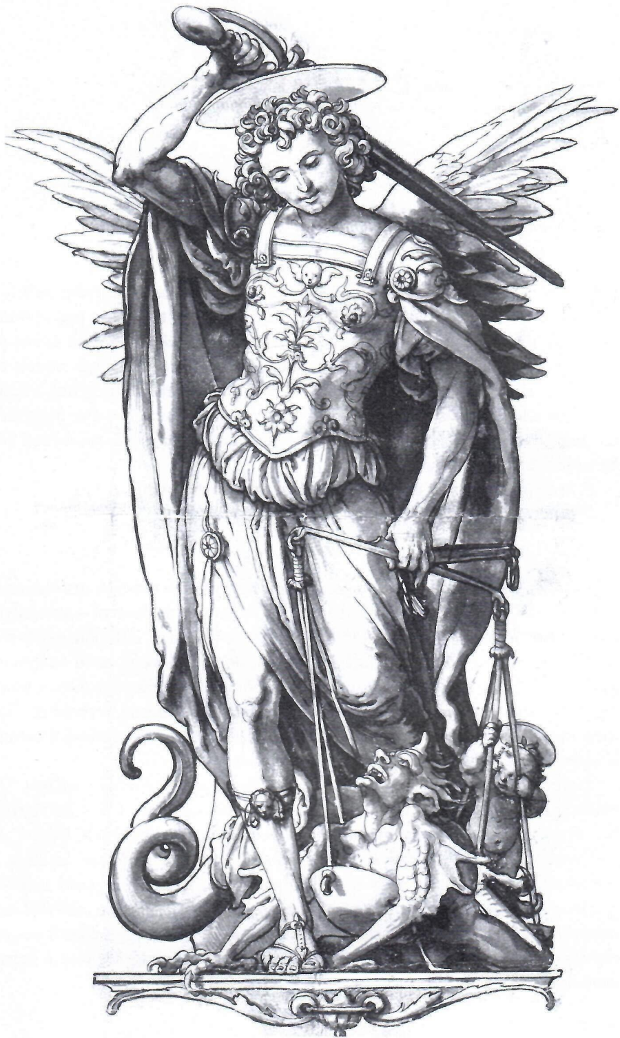
Szent Mihály megméri a lelkeket (Ifj. Hans Holbein rajza).