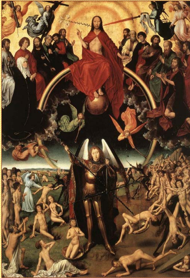
Hans Memling: Az utolsó ítélet

44. A TANÍTVÁNY MONDJA: Voltaképpen mi az emberi test?